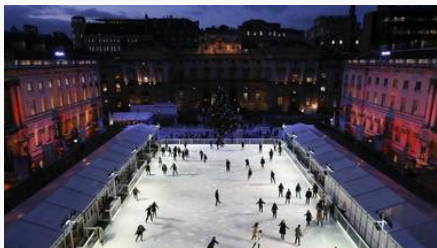
London: Slik kan det se ut også i Sandnes